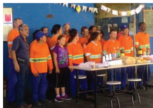
Unidade de Itapira