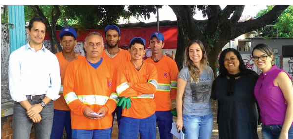
Unidade de Capivari