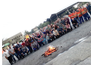
Unidade de Itu