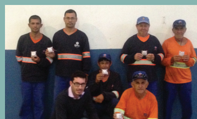
Unidade de Lorena