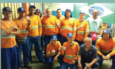
Unidade de Itapira