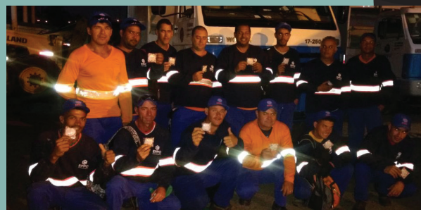
Unidade de Capivari