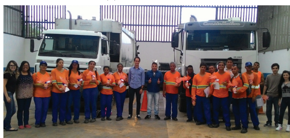
Unidade de Lorena