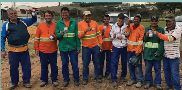
Unidade de Cabreúva