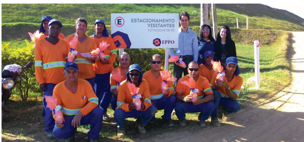
Aterro Sanitário - Itu

Mais do que receber um ovo de chocolate de Páscoa, durante a semana do dia 10 de abril toda a Eppo teve um momento de reflexão sobre o verdadeiro significado dessa data festiva: a ressurreição de Cristo.