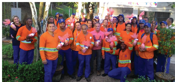
Equipe de Motoristas - Itu