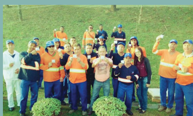
Unidade de Itu