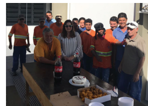
Unidade de Louveira