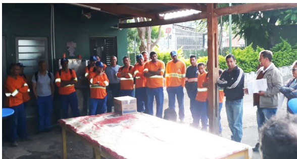
Unidade de Itu (Cidade Nova).