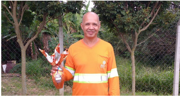
Unidade de Itu (Ecoponto Cidade Nova).