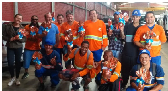
Unidade de Cachoeirinha.