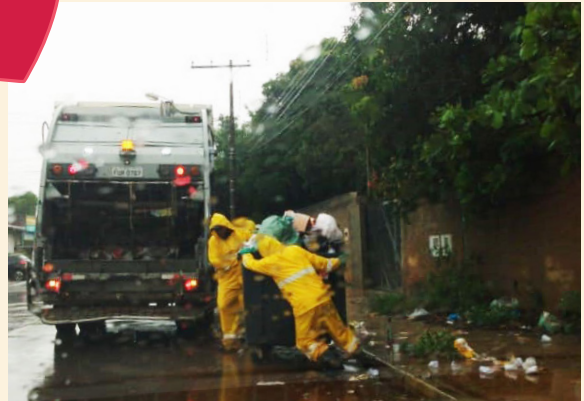
Faça sol ou chuva, nossos colaboradores estão a todo vapor! (Equipe de Cabreúva).