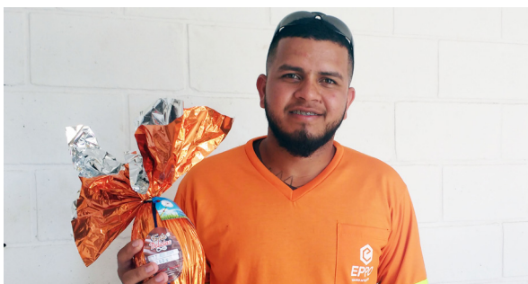
Unidade de Itu (Ecoponto Padre Bento).