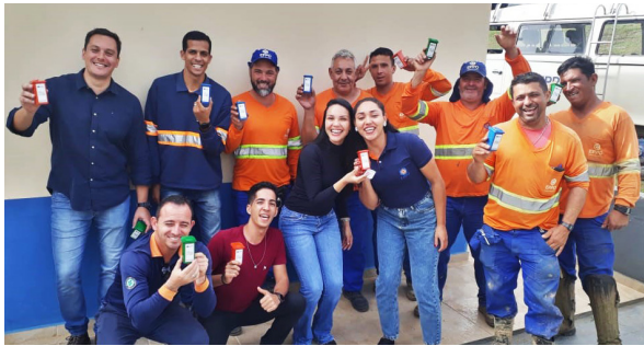
Unidade de Itu (Aterro Sanitário).