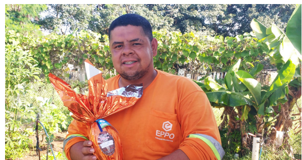
Unidade de Itu (Ecoponto São Judas Tadeu).