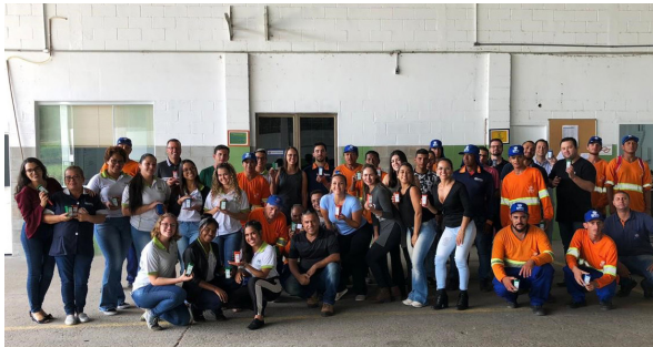
Unidade de Itu (CCO e varrição noturna).