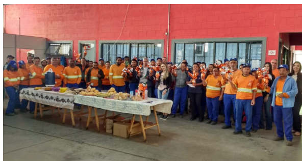
Unidade de Cabreúva.

Entre os meses de março e abril, nossos colaboradores foram abordados com a ação de Páscoa, recebendo um ovo de chocolate e participando de uma roda de conversa sobre o verdadeiro significado dessa data comemorativa. Páscoa simboliza renascimento e, mediante esse fato, é importante olharmos para dentro de nós, buscando a cada dia que se inicia nos tornarmos pessoas melhores.