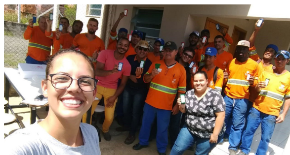
Unidade de Capivari.