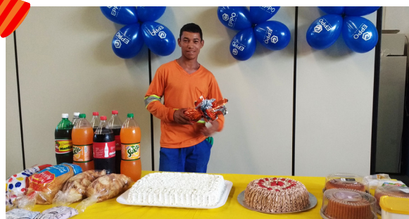
Unidade de Lorena (Março).