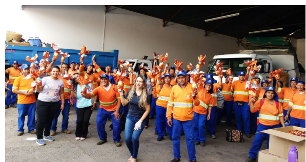
Unidade de Itu (Serviços gerais e varrição diurna).