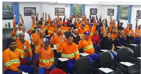
Unidade de Itu (Coleta diurna).