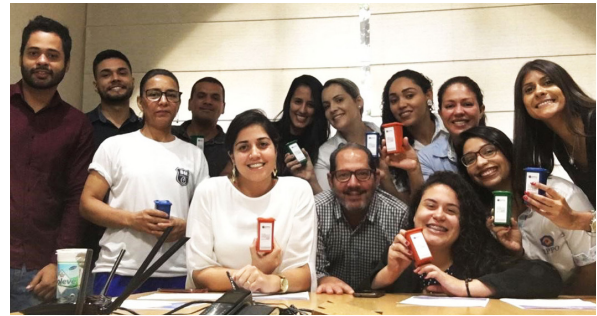
Unidade de Itu (Bairro Brasil).