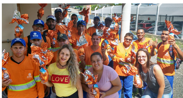
Unidade de Capivari.