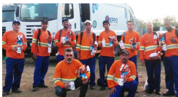
Unidade de Guaíba.