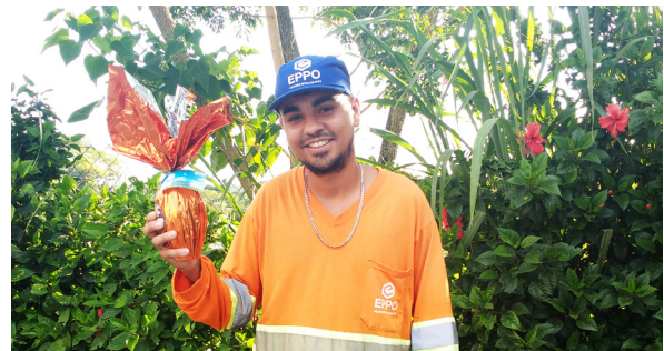
Unidade de Itu (Ecoponto Jardim Santa Rosa).