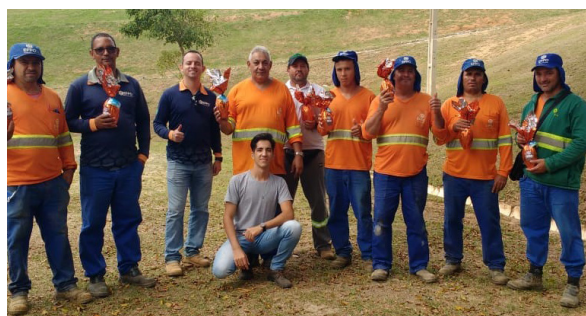
Unidade de Itu (Aterro Sanitário).