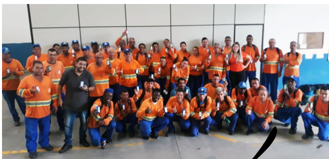
Unidade de Lorena.

2019 melhores empresas você s /ia para trabalhar