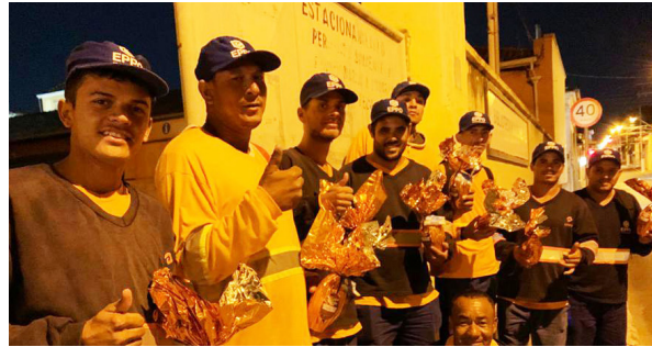
Unidade de Itu (Varrição noturna).