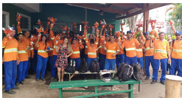
Unidade de Itu (Cidade Nova).