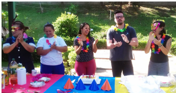
Unidade de Itu (CCO).

Confira a seguir como foi a comemoração dos Aniversariantes do Mês em algumas unidades da EPPO: