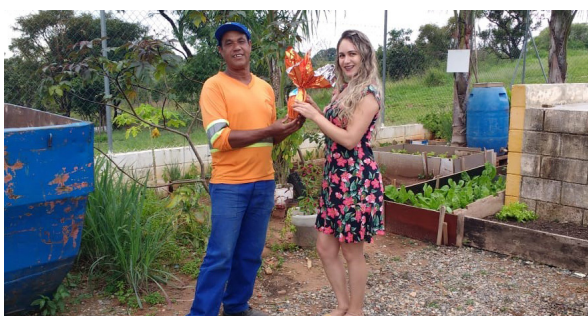
Unidade de Itu (Ecoponto Vila Martins).