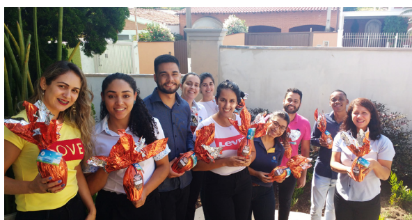
Unidade de Itu (Bairro Brasil).