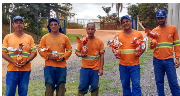
Unidade de Itu (Aterro de Inertes).