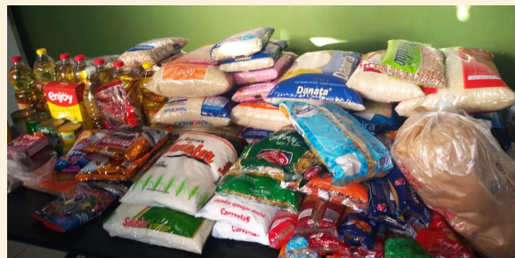
Arrecadação de alimentos dos colaboradores de Itu (Cidade Nova), para um amigo da equipe.