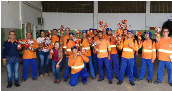
Unidade de Itu (Coleta noturna).