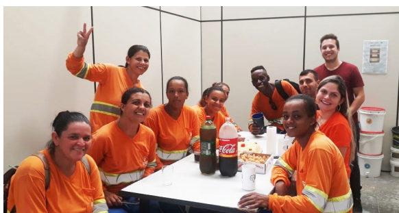
Unidade de Lorena (Fevereiro).