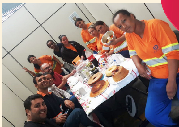
Café da manhã com os colaboradores da unidade de Lorena.