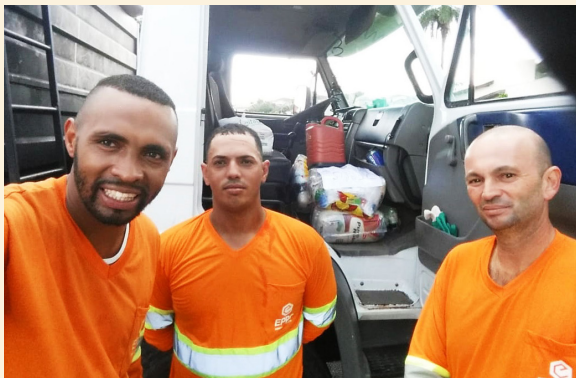
Doação de alimentos da comunidade, para a equipe de coleta de Itu, nos dias de quarentena.