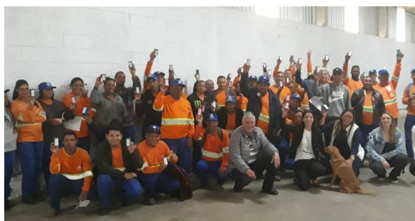
Unidade de Cabreúva.

Nos primeiros meses desse ano, as equipes de todas as unidades da EPPO receberam o resultado da pesquisa de clima de trabalho 2019, que permitiu estarmos entre as 150 melhores empresas para se trabalhar no Brasil. Nossa liderança operacional foi a responsável por levar essas informações para os colaboradores, somadas à entrega de um brinde de agradecimento e um delicioso café com aperitivos.