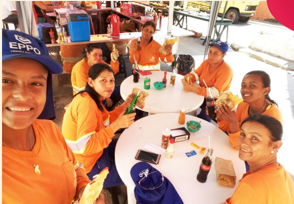
Equipe de varrição de Lorena, na hora do lanche.