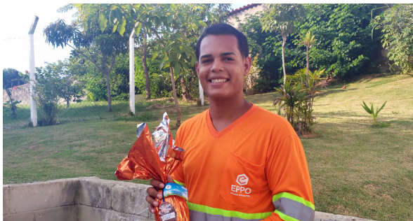
Unidade de Itu (Ecoponto Jardim das Rosas).