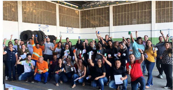
Unidade de Itu (CCO).