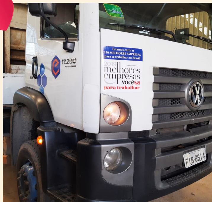
Caminhão de coleta EPPO com adesivo Estamos entre as 150 melhores empresas para se trabalhar no Brasil.