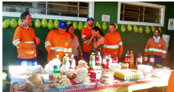
Unidade de Itu (Cidade Nova).