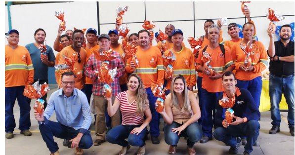
Unidade de Lorena.